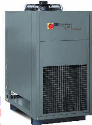
ProfiCool Genius (mit Option Sonderfarbe RAL 7043, verkehrsgrau B)