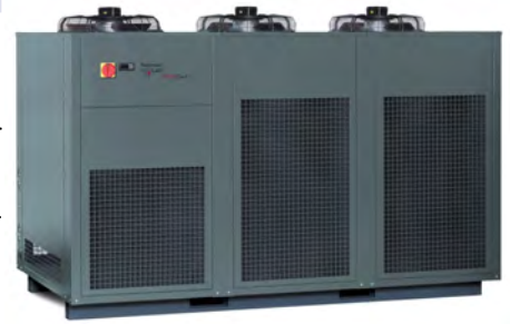
ProfiCool Genius (mit Option Sonderfarbe RAL 7043, verkehrsgrau B)