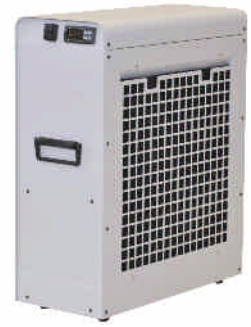
ProfiCool Primus PCPR 020