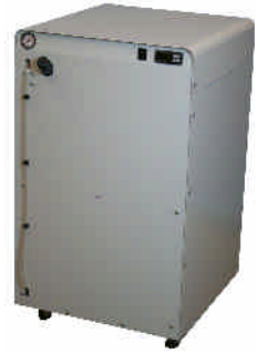
ProfiCool Primus PCPR 055 (mit Option Rollen)