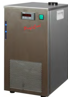
ProfiCool Filius PCFi 06