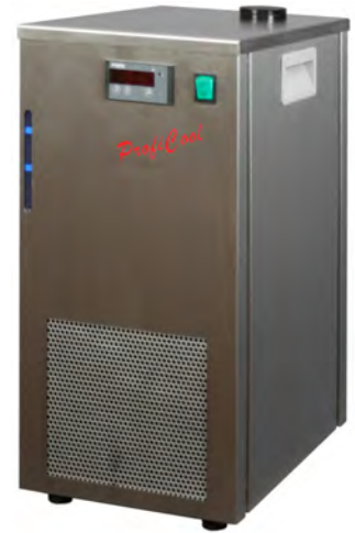
ProfiCool Filius PCFi 20 (Ausführung mit Füßen statt Rollen)